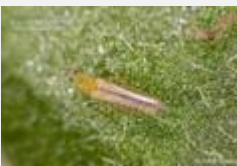
⇒ Fagyaltripsz (Dendrothrips ornatus)

Szívogatása eredményeképp a fagyalleveél színe ezüstösre változik. Az 1 mm-nél is kisebb kártevő kifejlett alakja és a lárvái is károsítanak. Ennek hatására a levelek torzulnak és tömegesen hullhatnak, így a dísznövényünk már nyár közepére felkopszodhat. Általában a mostoha körülmények között tengődő, legyengült növényeket támadják, és lepik el