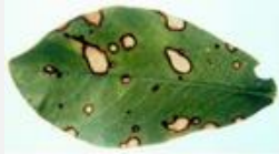
⇒ Fillosztiktás levélfoltosság

Csapadékos időjárás esetén ezzel fertőződhet a dísznövényünk