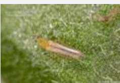
⇒ Fagyaltripsz (Dendrothrips ornatus)

Szívogatása eredményeképp a fagyalleveél színe ezüstösre változik. Az 1 mm-nél is kisebb kártevő kifejlett alakja és a lárvái is károsítanak. Ennek hatására a levelek torzulnak és tömegesen hullhatnak, így a dísznövényünk már nyár közepére felkopaszodhat. Általában a mostoha körülmények között tengődő, legyengült növényeket támadják, és lepik el