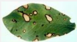
⇒ Fillosztiktás levélfoltosság

Csapadékos időjárás esetén ezzel fertőződhet a dísznövényünk