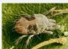
⇒ Takácsatka (Tetranychus viennensis)

További jelentős kártevőm a ⇒ Takácsatka