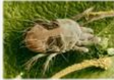
⇒ Takácsatka (Tetranychus viennensis)

További jelentős kártevőm a ⇒ Takácsatka